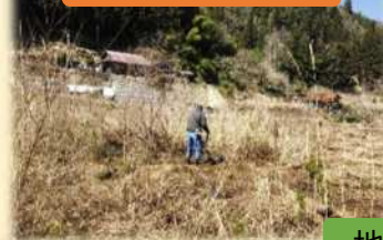
整備作業・草刈り